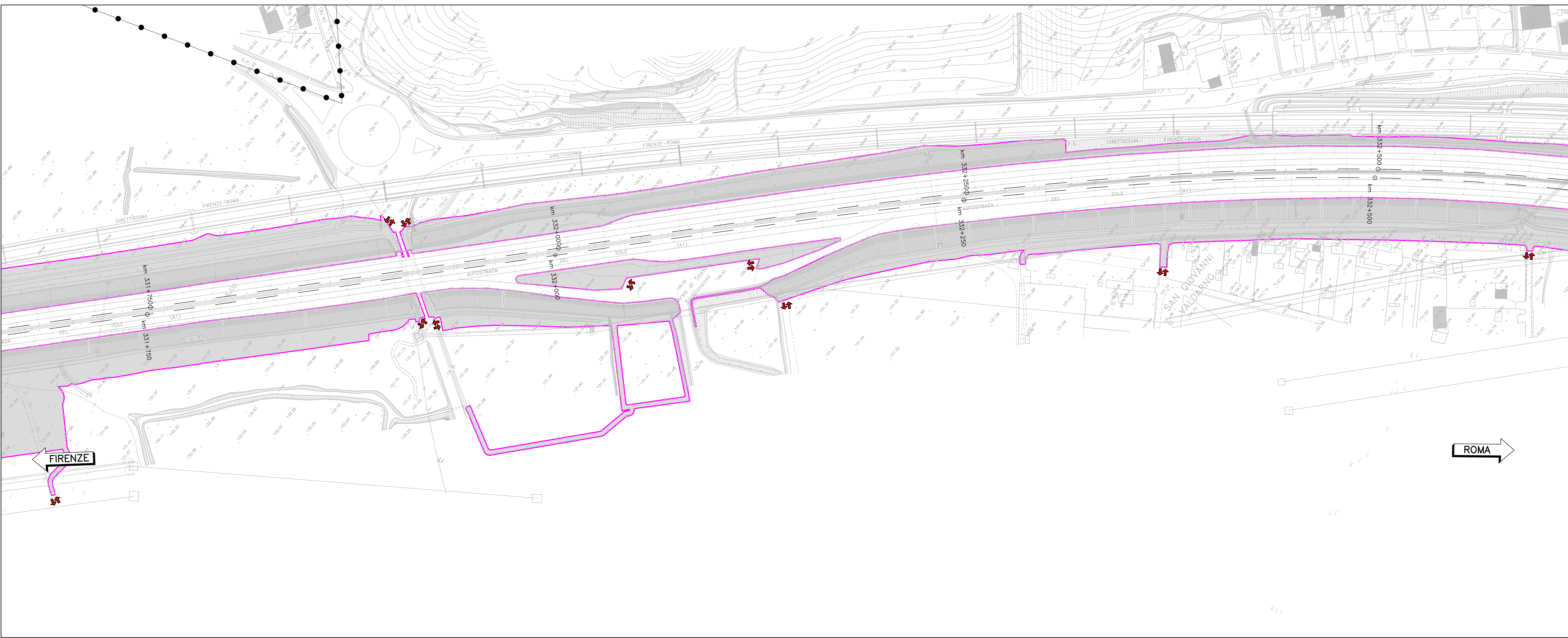
PLANIMETRIA DELIMITAZIONE AREE BOB E UBICAZIONE ACCESSI (1:1000)